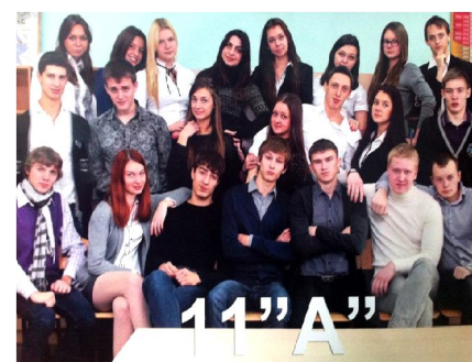
30 сентября 2013 Выпускники - 2012